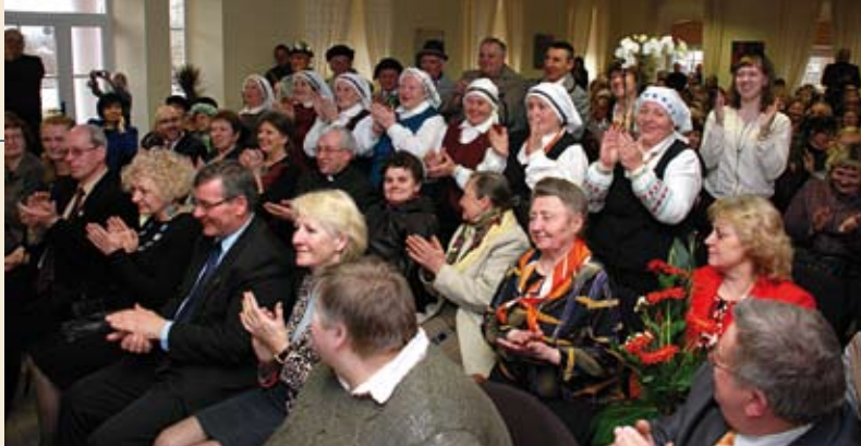
Taip susirinkusieji reagavo, kai buvo teikiami apdovanojimai Kultūros centro darbuotojams.

Darnus visų skyrių kolektyvas, kurį su pagalbiniais sudaro 28 darbuotojai, draugiškai dalijasi 14,89 etato, iš kurių 9,25 tenka centro direktorei ir meno vadovams. Šaržuojant šią padėtį būtų galima tarstelėti: o kam dabar lengva? Tačiau šiame, kaip ir kituose keliuose šimtuose Lietuvoje veikiančiuose kultūros centruose, savo darbą mylintys ir jam atsidavę kultūrininkai dirba daugiau iš idėjos, nei medžiaginės paskatos.