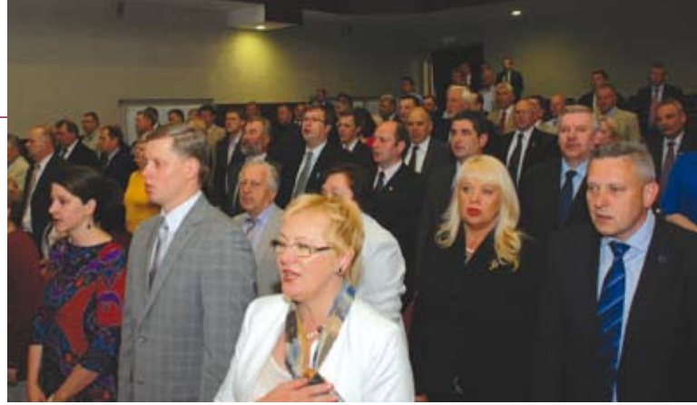
Suvažiavimo dalyviai giedoję himną, pirmą kartą be jokių išankstinių įrašų.

Socialinėje srityje vyksta ir kiti pertvarkymai – savivaldybių iniciatyva sudaryta darbo grupė rengia naują socialinės globos įstaigų finansavimo tvarką, vykdoma vaiko teisių apsaugos reforma.