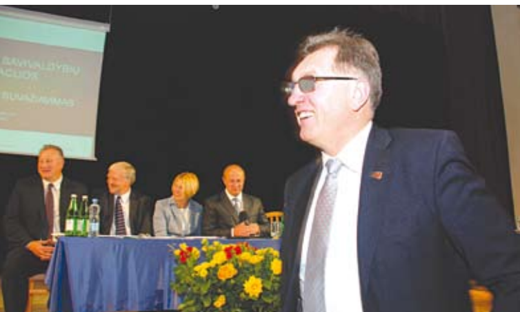
Ministras Pirmininkas linkėjo, kad savivaldybės su Vyriausybe dirbtų kaip vienas kumštis.

Savivaldybių specialistai jau susipažino su nauju Paramos būstui įsigyti ar išsinuomoti įstatymo projektu. Jame numatomos naujovės: būsto nuomos mokesčio dalies kompensacija šeimoms, turinčioms teisę į socialinį būstą, ir galimybė privatizuoti savivaldybės nuomojamus būstus, kuriems netaikomos socialinio būsto sąlygos.