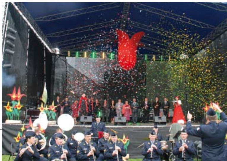
Scenoje susirinę rajono vadovai ir svečiai paskelbė Tulpių žydėjimo šventės atidarymą.

Geležinkeliu ir automobiliais į Radviliškį suvažiavę šalies vadovai tam kartui patraukė žiniasklaidos dėmesį. Ne vienam skaitytojui ar klausytojui įsiminė Burbiškio pavadinimas. Radviliškio rajonas kol kas ne itin garsėja poilsiaviečių gausa, tačiau tas pats Burbiškis ketina viešbučiu ir kemperių aikštele pritraukti daugiau turistų. Kažin ar aukšti pareigūnai, kol bus postuose, keliaus kemperiais kaip paprasti žmonės, tačiau jie savo darbą atliko. O laisviau keliaujantys piliečiai gali sau leisti apvažiuoti daugiau lankytinų Radviliškio rajono vietų: Baisogalos ir Diktariškių dvarus, Šeduvą, Kleboniškių kaimo buties ekspoziciją, Raginėnų archeologijos paminklų kompleksą.