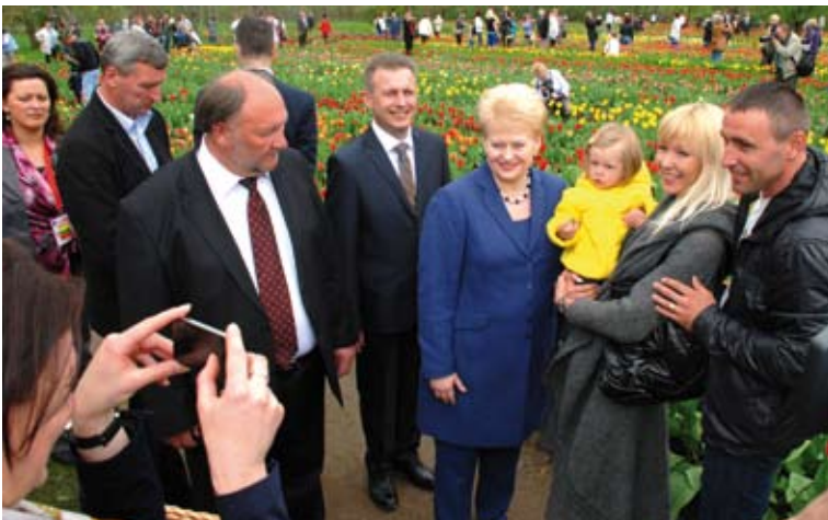
Lankydamosi Burbiškio dvare Prezidentė bendravo su žmonėmis, fotografavosi su jais, vaikams dalijo saldainius, dvaro parke pasodino ažuoliuką.