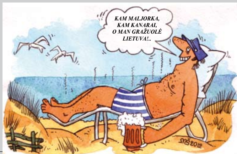
Mečislavo Ščepavičiaus pieš.

Atsižvelgiant į visų šalių respondentų vertinimus ir svarbiausius makroekonominius rodiklius bei įvertinus subindeksus (pagrindinių reikalavimų, našumą (efektyvumą) skatinančių veiksmų ir inovatyvumo bei verslo lankstumo), PEF skaičiuoja kiekvienos šalies Bendrą konkurencingumo indeksą (BKI). Remiantis BKI vertinimais, šalis skirstomos į ekonominio išsivystymo etapus. Iki 2008 m. Lietuva buvo priskiriama prie tų šalių, kuriose ekonomika grindžiama našumu. Nuo 2009 m. Lietuva, kaip ir Latvija su Estija, priskiriama prie šalių, pereinančių į naujovėmis grindžiamą ekonomiką.