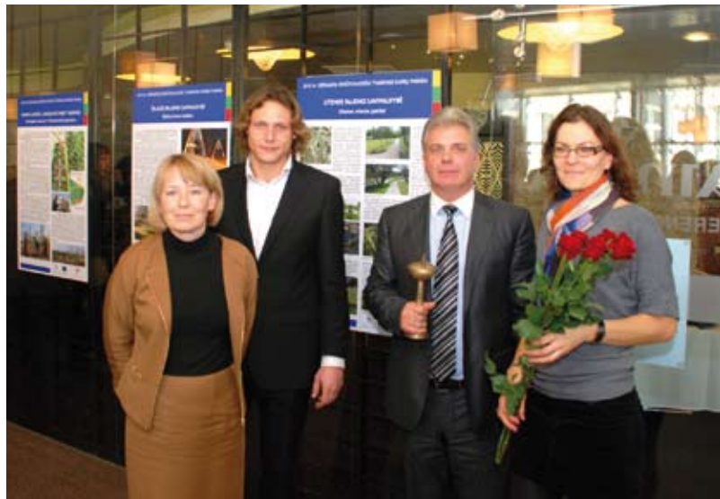
2012 m. Utenos parkus pripažinus geriausiu kraštovaizdžio tvarkymo pavyzdžiu Lietuvoje, savivaldybei skirtas Aplinkos ministerijos diplomą „Už kraštovaizdį“, kuris įpareigoja Uteną atstovauti Lietuvai Europos Tarybos 2013–2014 metų kraštovaizdžio konkurse