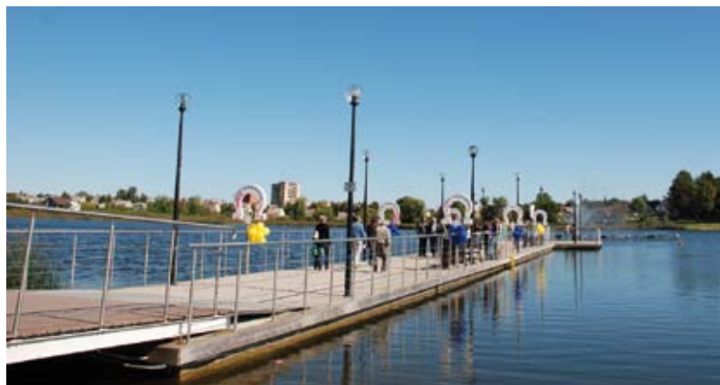
Šiandien uteniškiai džiaugiasi rekreacinėmis zonomis. Viena jų – Dauniškio ežeras su fontanais