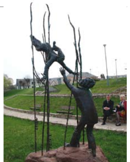
Kupiškyje veikia Henriko Orakausko skulptūrų muziejus po atviru dangumi

dangumi“ – tai vienas naujausių turistinių maršrutų, atskleidžiančių savitą miesto veidą ir supažindinančių su skulptoriaus kūryba.