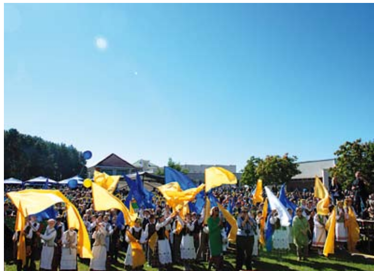
Šiemet Utena šventė 752-ąjį gimtadienį