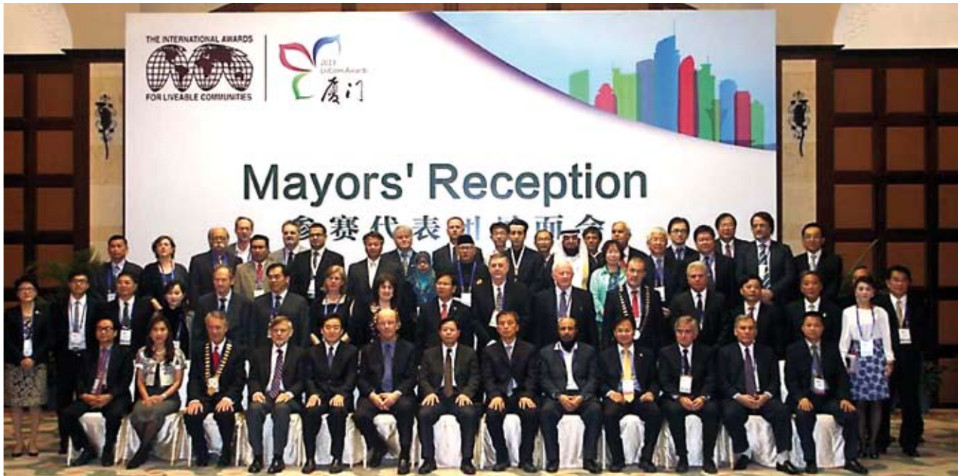
Utenos pasiuntiniai tarp vieno didžiausių UNESCO konkurso dalyviu

Jungtinių Tautų Organizacijos globojamame konkurse „The International Awards for Liveable Communities 2013“ (sutrumpintai LivCom – „Gyvybingiausių bendruomenių apdovanojimai 2013“), kuriame iš 500 pretendentų varžėsi atrinkti 60 miestų iš bemaž 30 pasaulio šalių, Utena savo kategorijoje, tarp miestų, turinčių 20–75 tūkst. gyventojų, pripažinta tokiu, kuriame geriausia gyventi. Čia buvo akcentuota, kad pastaraisiais metais pramoninis miestas Utena patyrė pokyčių, po kurių jame atsirado parkų, skverų, išplėsta turizmo veikla.