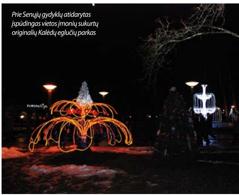
Prie Senųjų gydyklų atidarytas įspūdingas vietos įmonių sukurtų originalių Kalėdų egļučių parkas

Kalbėdamas apie laisvalaikio organizavimą kurorte meras tvirtino, kad dabar turi nemažai pasiūlymų, tad verslui linkėjo būti