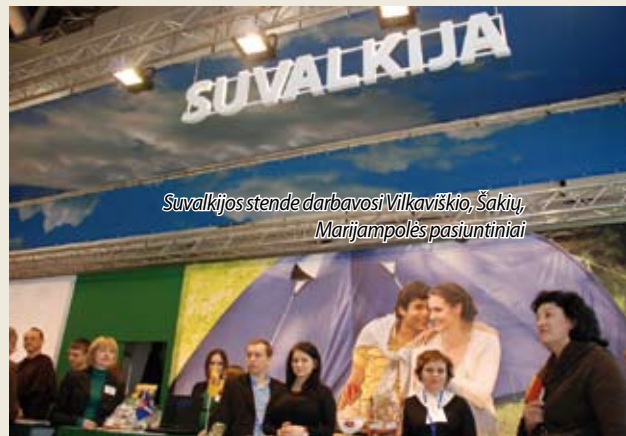
Suvalkijos stende darbavosi Vilkaviškio, Šakių, Marijampolės pasiuntiniai