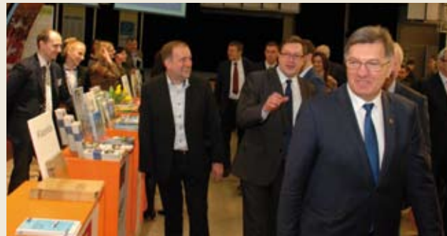
Šilutės meras Š. Laužikas (kairėje) pralinksmino Premjerą A. Butkevičių ir įteikė jam naują Kuršių marių navigacinį žemėlapi