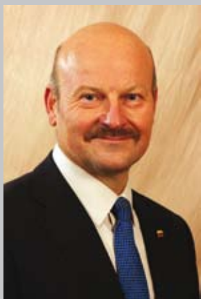
Algis Strelčiūnas Seimo narys

Matydami didelį gyventojų susirūpinimą švarios aplinkos išsaugojimu, mes – Seimo Aplinkos komiteto pirmininkas Algimantas Salamakinas ir Seimo narys Algis Strelčiūnas – kovo 19 d. surengėme konferenciją „Atliekų deginimo įmonių poreikis Lietuvoje“, kurioje šia aktualia tema kalbėjo kompetentingi, visuomenėje žinomi specialistai ir mokslininkai.