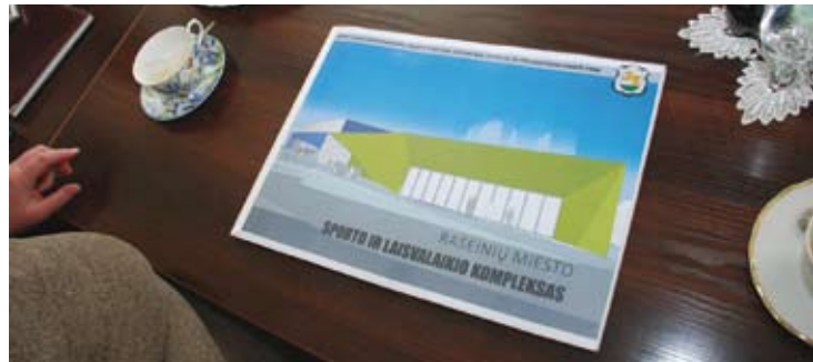
Raseiniai žvelgia į ateitį. Neseniai atlikta Raseinių miesto sporto ir laisvalaikio komplekso statybos studija

nueita ir iki teismų, tačiau jau gegužę savivaldybė planuoja pasirašyti naują sutartį su kitais rangovais. Kitose Raseinių rajono priemiestinėse gyvenvietėse minimi darbai sėkmingai juda į priekį.