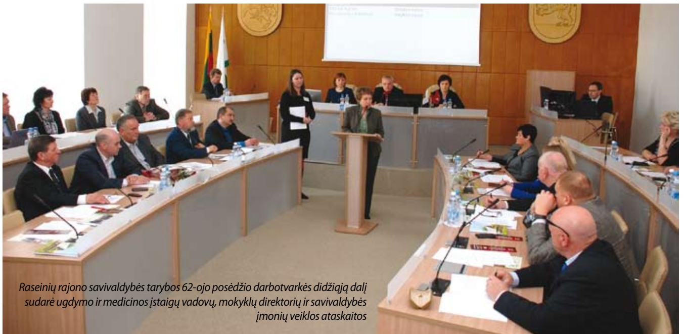
Raseinių rajono savivaldybės tarybos 62-ojo posėdžio darbotvarkės didžiąją dalį sudarė ugdymo ir medicinos įstaigų vadovų, mokyklų direktorių ir savivaldybės įmonių veiklos ataskaitos

Raseinių rajono vadovas skubėjo dalytis savivaldybės planais ir sumanymais. Guodėsi, kad Vilniaus gatvė nepuošia Raseinių miesto, tačiau čia pat aiškino, kad jau parengti projektai, paskaičiavimai ir kartu su Kelių direkcija, perdavus jai minimą gatvę, bus vykdomas bendras 14 mln. Lt vertės projektas, kurio metu sutvarkius pačią gatvę, šaligatvius, apšvietimą, miestas įgis visiškai kitą vaizdą.