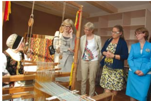
Pirmosios Amatų centro lankytojos