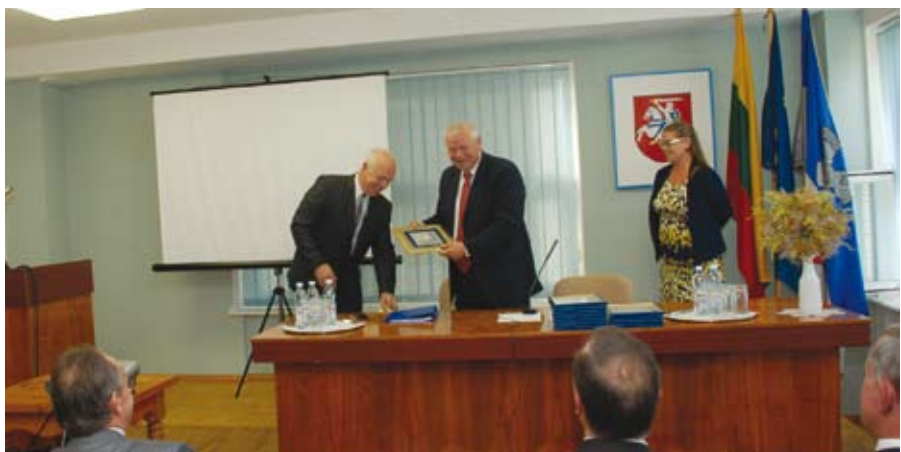
Konferencijos metu rajono merui už sėkmingą projektų įgyvendinimą buvo įteikta atminimo dovana