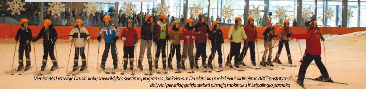
Vienintelės Lietuvoje Druskininkų savivaldybės švietimo programos „Kiekvienam Druskininkų moksleiviui slidinėjimo ABC“ pristatymo dalyviai per stiklą galėjo stebėti pirmąjį mokinuką iš Leipalingio pamoką

Druskininkų savivaldybės mokyklų šeštakai du kartus per mėnesį važinėja į žiemos pramogų kompleksą „Snow Arena“ mokytis slidinėti. Čia vyks kūno kultūros pamokos, kuriose vaikai mokysis kalnų slidinėjimo pagal specialiai moksleiviams parengtą mokymo programą.