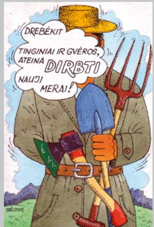
Mečislavo Šcepavičiaus pieš.

Žmones jaudina ne tiek didelės, dešimtmečius besitęsiančios statybos, nerestauruoti rūmai ar nebaigti stadionai, o kasdienės buitės problemos – ar bus mažesnės šildymo sąskaitos, ar jaunos šeimos be vargo galės savo atžalas nuvesti į vaikų darželius, ar kaimo žmonės galės važinėti išlygintais, pažvyrutais keliais, ar miestuose neliks duobėtų gatvių, apleistų, sulaužytais suoliukais poilsio aikštelių. Tad linkėtina energingiems merams ir atsinaujinusioms taryboms neskraidyti padebesiais, o dirbti paprastus, daugeliui žmonių gyvybiškai reikalingus darbus.