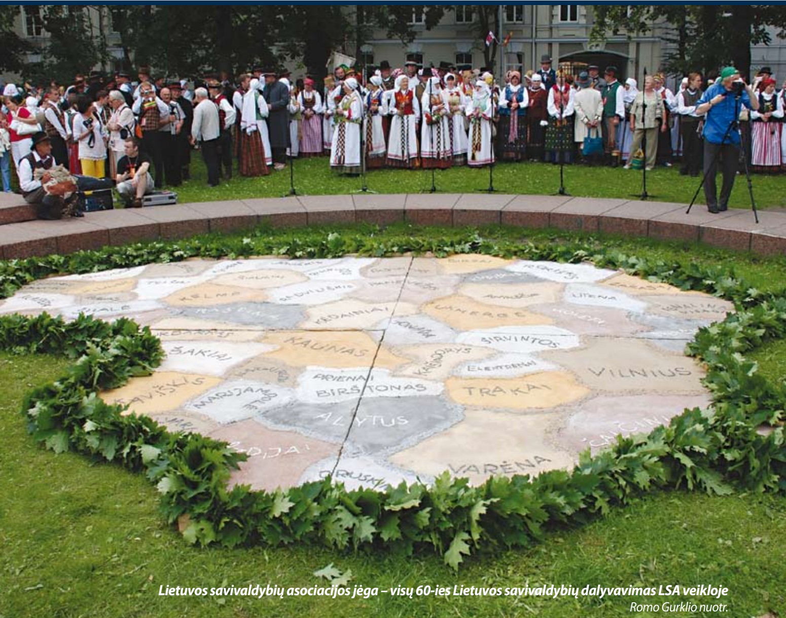
Lietuvos savivaldybių asociacijos jėga – visų 60-ies Lietuvos savivaldybių dalyvavimas LSA veikloje

2015 m. gegužės 23 d. Kaina 0,65 euro cento Išeina šeštadieniais