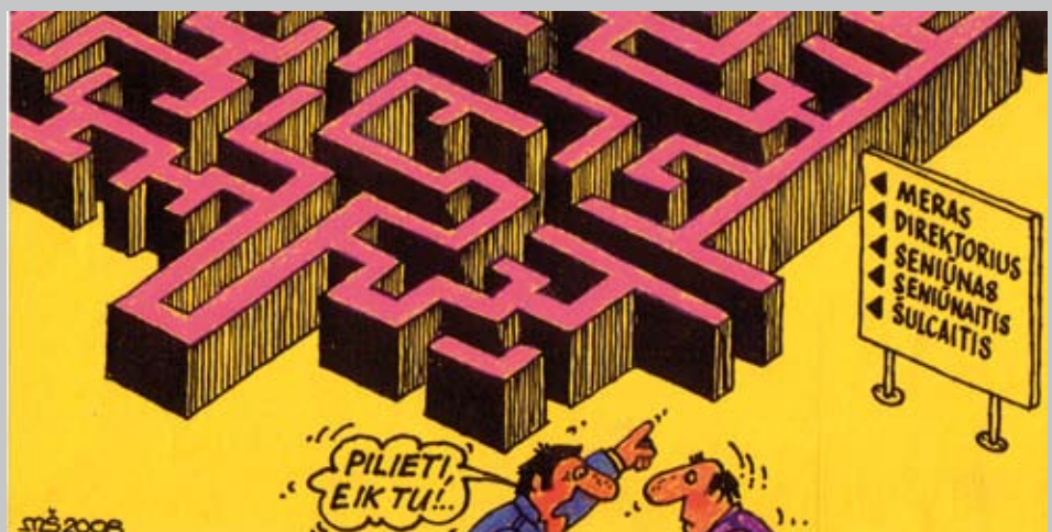
Mečislavo Ščepavičiaus pieš.

Šiuo metu, kai Lietuvoje daug kur perrenkami seniūnaičiai, matoma tendencija, kad rinkimuose dalyvauja daugiau žmonių nei praėjusiuose rinkimuose. Tai rodo žmonių požiūrį į šią arčiausiai jų esančią struktūrą. Seniūnaičių vaidmuo stiprėja: jie pradeda girdėti savivaldybėje, veikia ir steigiasi naujos seniūnaičių asociacijos („Asociacija Vilniaus seniūnaičiai“, „Kauno seniūnaičių asociacija“, 2015 m. gegužės 21 d. įsteigta „Lietuvos seniūnaičių asociacija“). Žmonės nori ir gali dalyvauti savivaldoje, o politikų darbas yra padėti, paskatinti ir suteikti jiems galimybes.