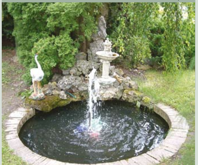
Akmenės botanikos sodo kampelis

Šiandieninio rajono plotas – 844 kv. km. 2015 m. Akmenės rajone gyvena beveik 24 tūkst. gyventojų, iš jų 53 proc. moterų ir 47 proc. vyrų. Didžiausią dalį – 64 proc. – sudaro asmenys nuo 19 iki 65 metų. 66 metų ir daugiau – 19 proc., 0–6 metų – 5 proc. ir 7–18 metų – 12 proc.