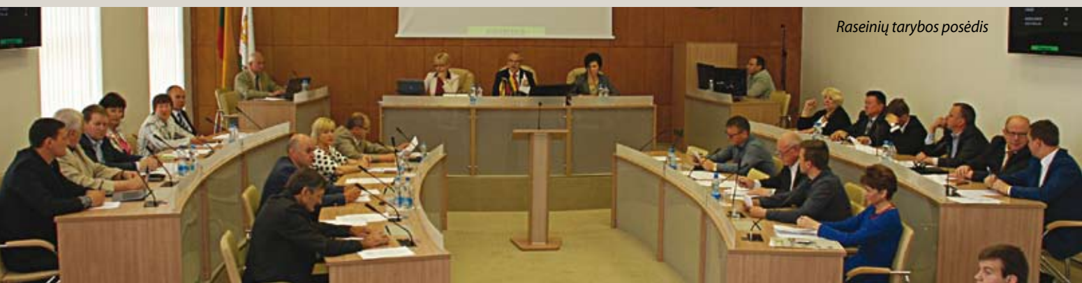
Raseinių tarybos posėdis

Tačiau, pasak mero, vis labiau ryškėja kita problema – dalis žmonių nebemoka dirbti. „Ketinu kreiptis į Socialinės apsaugos ir darbo ministeriją, Savivaldybių asociaciją, ir siūlysiu numatyti programą socialiniams įgūdžiams stiprinti. Socialinės pašalpos dalį žmonių visiškai atpratino nuo darbo. Liūdniausia, kad jau auginame trečią-ketvirtą iš pašalpų gyvenančių žmonių kartą, – apgailėstauja politikas. – Galbūt prie šių žmonių darbo įgūdžių stiprinimo galėtų prisidėti ir darbo biržos. Jos kartu su rajonuose esančiais švietimo centrais, verslo įmonėmis galėtų imtis šios iniciatyvos.“