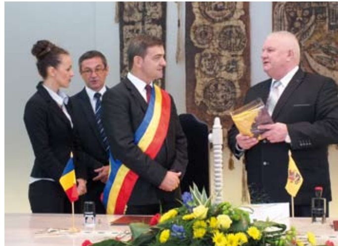
Šventės išvakarėse marijampoliečiai su rumunais pasirašė bendradarbiavimo sutartį