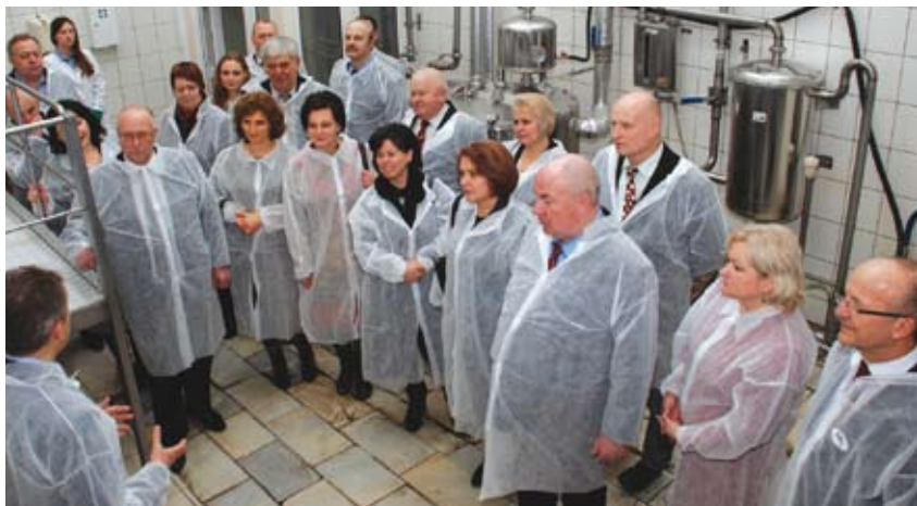
Dalyvavo edukacineje programoje, supažindinančioje su lietuviško midaus gamybos tradicijomis ir įmonės istorija