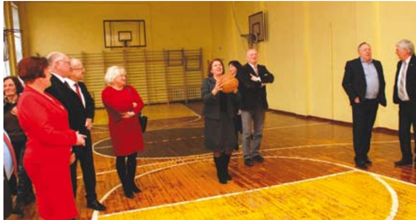
Remonto laukiančioje gimnazijos sporto salėje pasitinkino rankos taiklumą