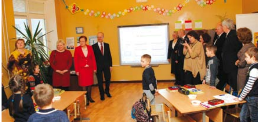
Stakliškių gimnazijoje rajono tarybos nariai išbandė interaktyvią lentą

Kitas tarybos narių aplankytas objektas – UAB „Lietuviškas midus“ atnaujintas iš XIX a. išlikęs alaus daryklos bokštas. Šiuo metu jis naudojamas edukacinei programai, kurios metu supažindinama su lietuviško midaus gaminių istorija ir tradicijomis.