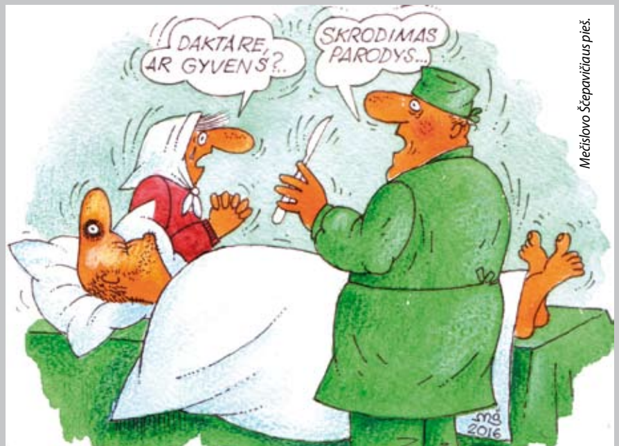
Mečislavo Štepačiūnas pieš.

Kas turėtų pasakyti, kad reforma, daroma pačių sistemos dalyvių užsakymu, negali būti naudinga visuomenei?