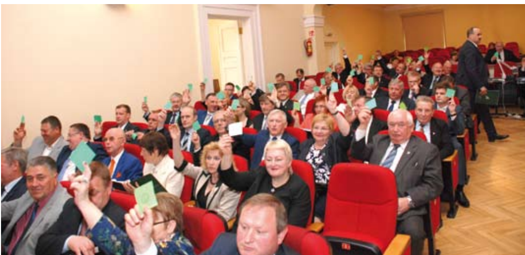
Rezoliucija „Dėl neatlygintino registru ir informacinių sistemų duomenų teikimo savivaldybėms“ priimta vienbalsiai

Taip pat, atsižvelgus į LSA pasiūlymą, savivaldybėms bus sudarytos sąlygos panaudoti praėjusiais metais nepanaudotą pajamų dalį trumpalaikiams įsiskolinimams dengti arba, jų nesant, kitoms reikmėms. Be to, numatyta papildomai skirti savivaldybėms dotacijas siekiant užtikrinti nuosavą indėlį, kuris būtinas