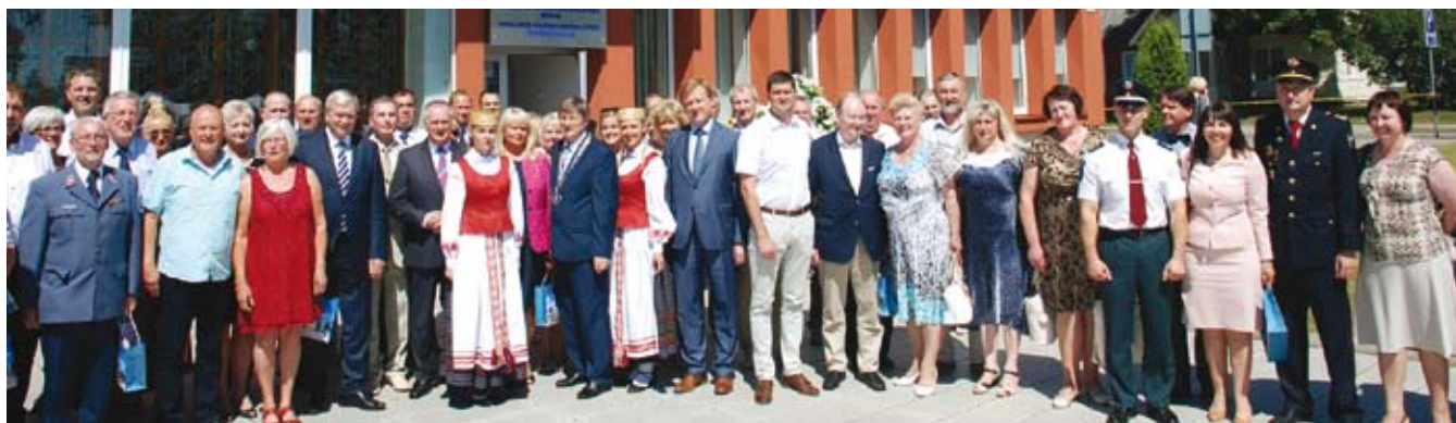
Rajono tarybos nariai ir svečiai po iškilmingo posėdžio

Pavakariais nuo Ignalinos kultūros centro iki miesto vasaros estrados, lydimos orkestro „Panevėžio garsas“, žygavo šventinės eitynės. „Skambėk, Ignalina, kaip gražiausia lėja Europos širdyje“, – skandavo eitynių dalyviai.