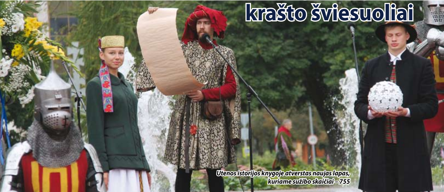
Utenos istorijos knygoje atverstas naujas lapas, kuriame sužibo skaičiai – 755