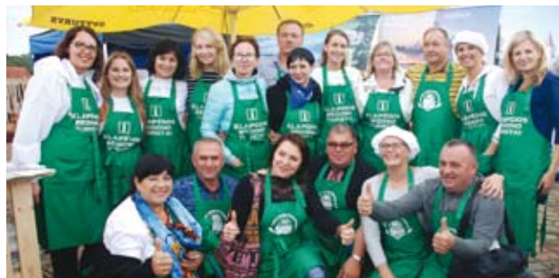
Pirmą kartą čempionate dalyvavo susivieniję Klaipėdos regiono turizmo informacijos centrai