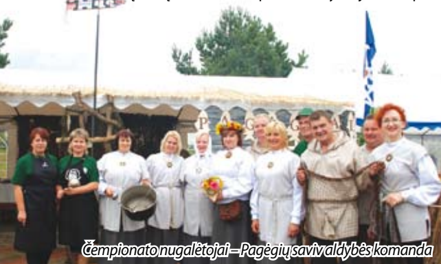
Čempionato nugalėtojai – Pagėgių savivaldybės komanda

Pirmą kartą žuvenies čempionate dalyvaujanti Klaipėdos regiono turizmo informaci-