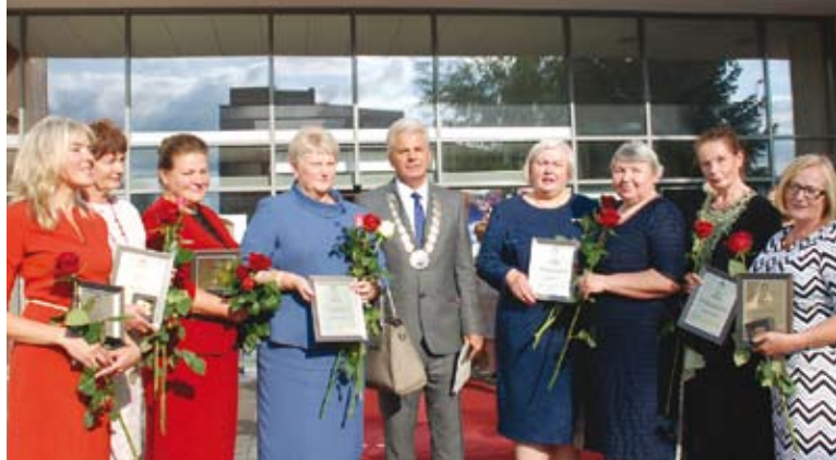
„Apdovanojome ir keletą savivaldybės administracijos darbuotojų. Nemanau, kad teisinga nuostata, jog reikia pagerbti savivaldos tarnautojų“, – sakė meras

Šventė baigėsi fejerverkais ir prieš penkerius metus miestui dovanoto šviečiančio grojančio fontano nauja programa.