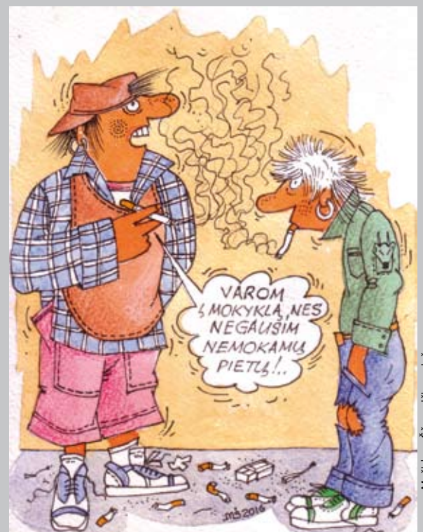
Mečišlovo Šėpavičiaus pieš.