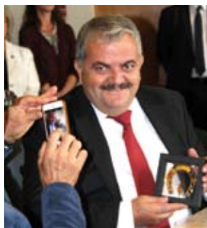
„Gintarinė pasaga“ įteikta ir palestiniečiams