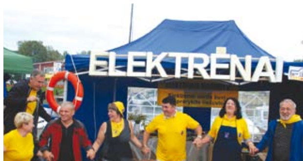
Visuose čempionatuose dalyvauja Elektrėnų „Elektrinis unguris“