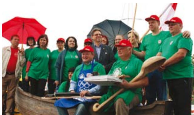
Šilališkiams žuvenies čempionate sekėsi kiek prasčiau negu Rio de Žaneire