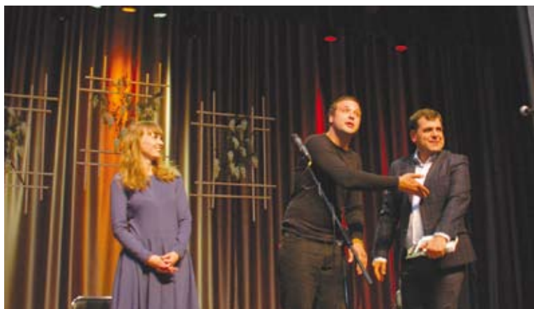
Scena iš I. Šeiniiaus kūrybos motyvais sukurtos meninės-literatūrinės kompozicijos „Žmogus tik meilėje gali laimingai gyventi“