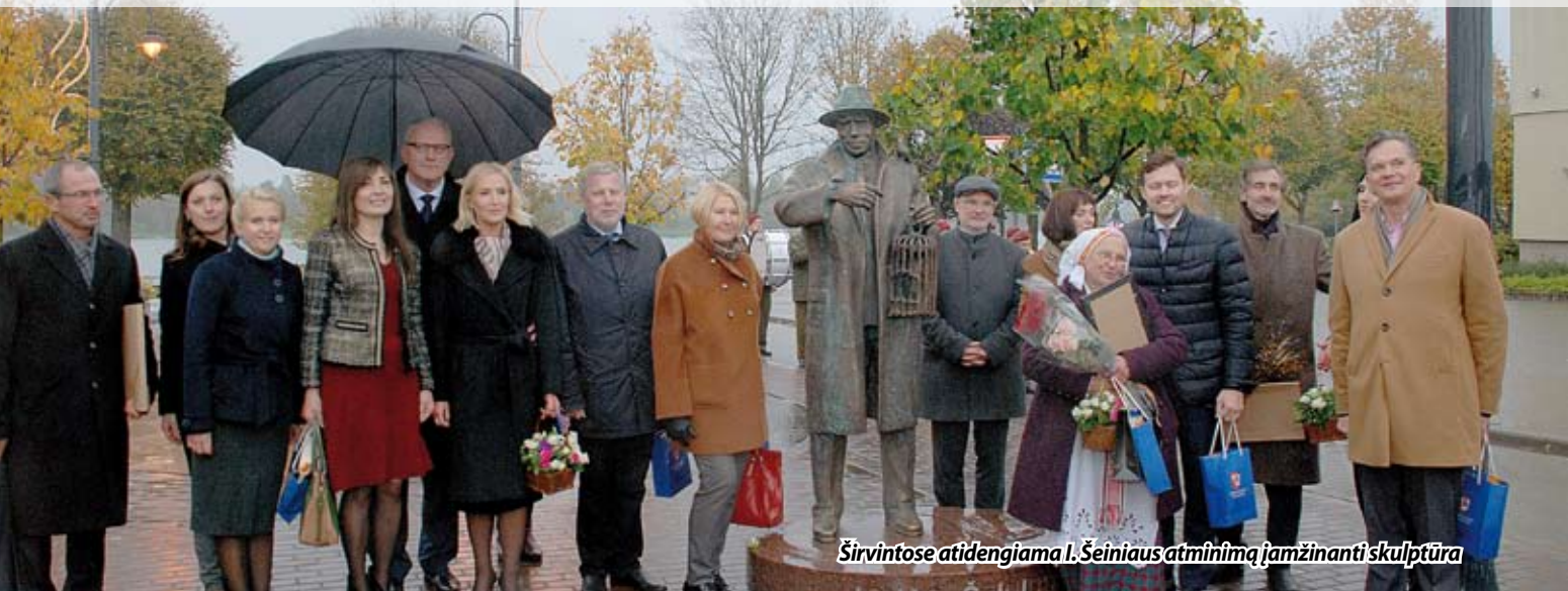
Širvintose atidengiama I. Šeiniaus atminimą įamžinanti skulptūra