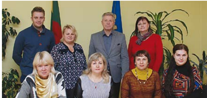
Vievio seniūnijos komanda

Vievio seniūnija įsikūrusi nuostabiame kraštovaizdyje, kurio galima pasigrožėti einant Neries regioniniu parku. Vis daugiau poilsiautojų suranda Vievio ežerą. Pasinaudojant ES parama poilsiui pritaikyta jo pakrantė. Vievio ežerą pamėgo buriuotojai. Norinčius geriau pažinti šalį kviečia Lietuvos kelių muziejus.