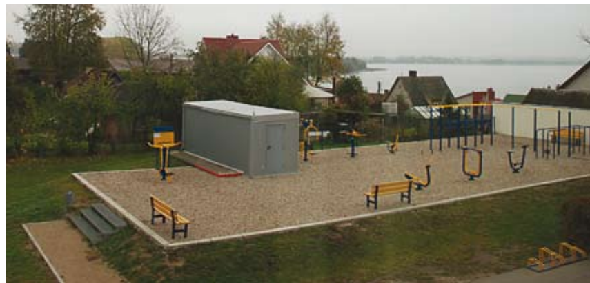
Prie seniūnijos pastatytus treniruoklius pamėgo ir jaunimas, ir vyresni miesto gyventojai