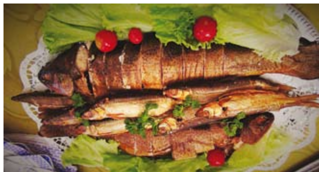
Žuvis – neatsiejama Zarasų kulinarijos paveldo dalis

R. Keršys. Apskritai yra nemažai sričių, kuriose susiduriame su pertekliniais biurokratiniais reikalavimais. Atsitinka ir taip, kad žaidimo taisyklės keičiamos žaidimo metu. Ir tada savivaldybei atsiranda papildomų išlaidų, atsiranda projektų koregavimas. Neretai patys sau reikalavimų kartelę išsikeliame žymiai aukščiau, negu numatyta ES teisės aktuose.