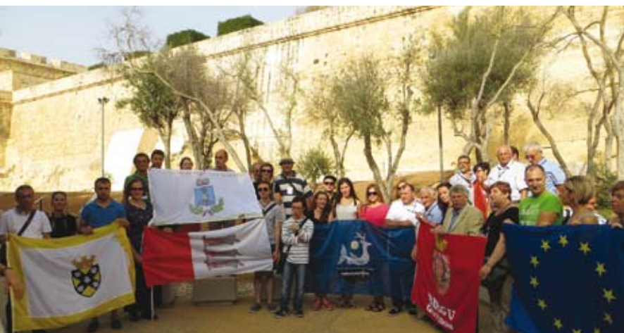
Bendro su maltiečiais ir latviais projekto dalyviai Maltoje

N. Gusevas. Išties, tam neturėjome daug laiko. Pirmiausia mūsų dėmesį atkreipė tai, kad savivaldybė, kurioje lankėmės, gerokai mažesnė už mūsų. Ji labiau prilygsta vienam Vilniaus mikrorajonui. Visa Malta prilygsta Vilniaus miestui, joje yra kelios savivaldybės, ir kiekvienoje yra taryba, meras, kitos valdymo struktūros.