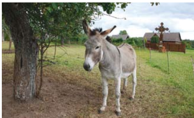
Zarasičių simboliu tampantis Baltriškių kaime įsikūrusis Tibriados bendruomenės vienuolynas ir asilukas