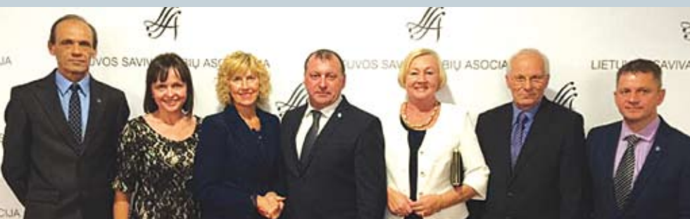
Zarasų rajono savivaldybės delegacija „Aukšinių krivių“ įteikimo šventėje

Per Valstybinį turizmo departamentą, per Lietuvos konsulatą Sankt Peterburge ir atsirado glaudesnis mūsų bendradarbiavimas. Konsulate vyko Zarasų pristatymas, kuriame dalyvavo ir žurnalistai, ir turizmo operatoriai. Neseniai Sankt Peterburge surengtas mūsų rajono prista-