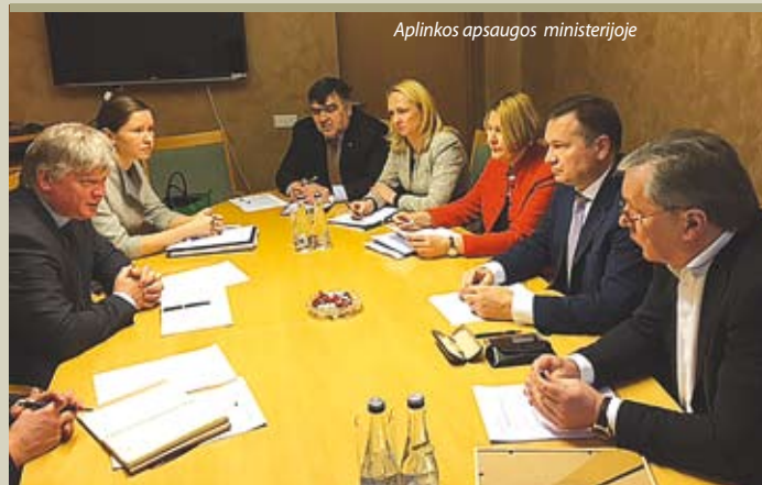
Aplinkos apsaugos ministerijoje