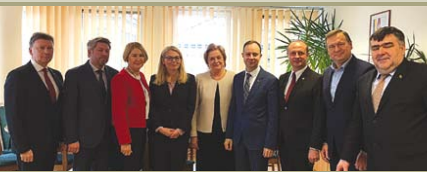
Sveikatos apsaugos ministerijoje