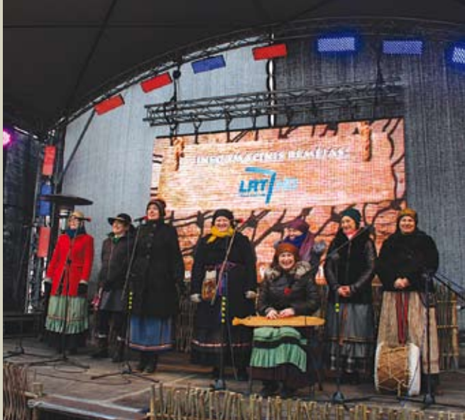
Nidos folkloro ansamblis „Giedružė“ dainomis sušildė susirinkusius į šventę. Ansamblis reprezentuoja Neringos kraštą įvairiuose Lietuvos ir tarptautiniuose festivaliuose, dainų šventėse