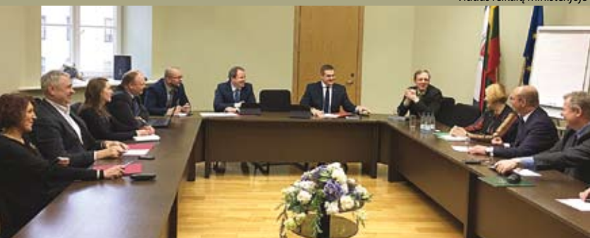
Vidaus reikalų ministerijoje