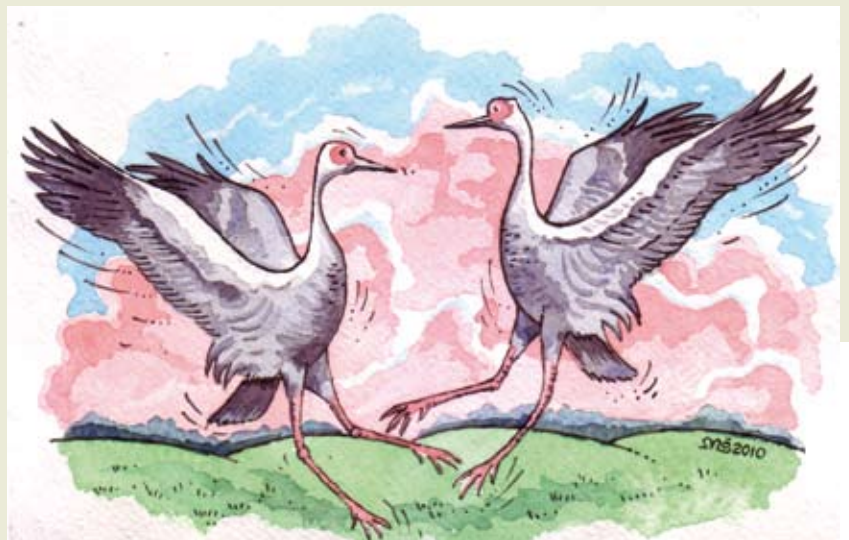
Mečislovo Ščepavičiaus pieš.