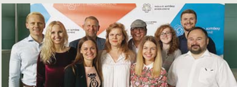
Mieste vyko Pasaulio alytiškių sambūris