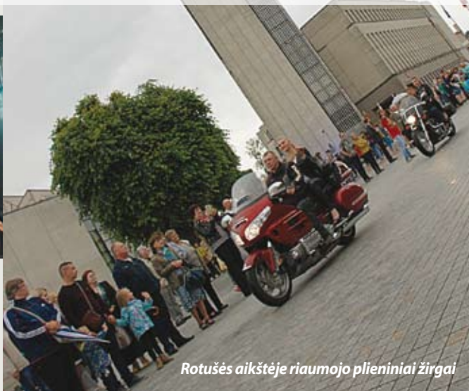
Rotušės aikštėje riaumojo plieniniai žirgai