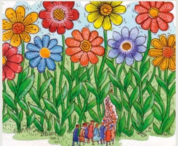
Mečislavo Ščepavičiaus pieš.