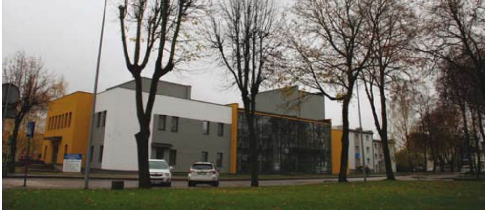
Savivaldybė buvo sumaniusi Lietuvos šimtmečio datą paženklinti moderniu kultūros centru

Negavus lėšų kultūros centro statyboms baigti, atsiranda nemažai sunkumų. Vienas jų – darbų rangų sutartis su pratęsimu pasibaigia 2018 metų birželį. „O tai reiškia, kad teks sustabdyti darbus, užkonservuoti objektą, per 2018–2019 metų šaltąjį periodą pastatą šildyti, o gavus finansavimą skelbti naują viešųjų pirkimų konkursą centro statybai. Tada neišku, kas laimės konkursą, kuris darbas iki kurio lygio užbaigias, kas gali sukelti teisinius ginčus, – galimas problema, jei finansavimą centrui baigti pavyktų gauti tik 2019 metais, vardija meras ir užsimena apie kultūros viceministro mestelą frazę: girdi, kodėl tokį ambicingą projektą reikėjo rinktis. – Išties kol kas tai būtų moderniausias kultūros centras regione, bet negi XXI amžiuje turime statyti daržinę?“