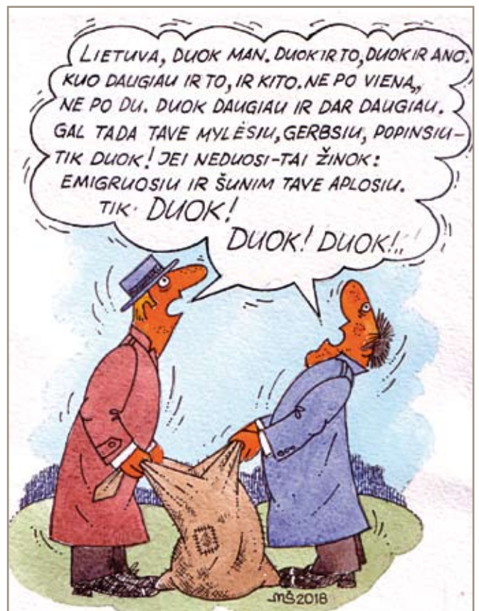
Mečišlovo Ščepavičiaus pieš.

Paklausime savęs, visų pirma savęs, ar viską padarėme, kad būtume laimingi. Tokie, kaip buvo Vileišiai ir jų palikuoniai.