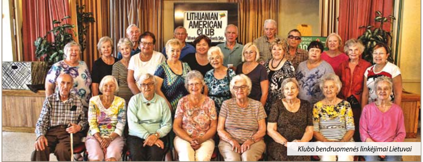
Klubo bendruomenės linkėjimai Lietuvai