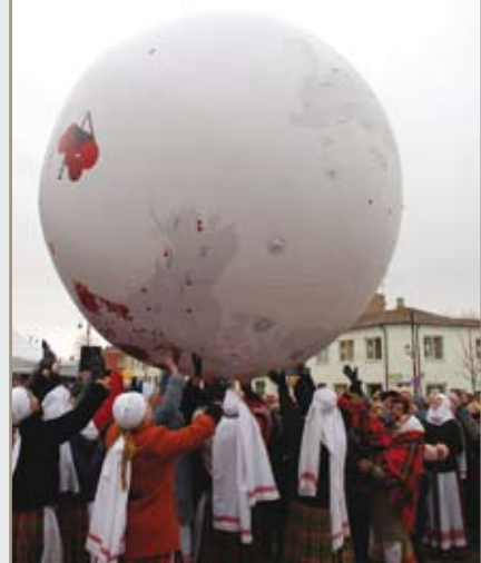
Susirinkusieji turėjo galimybę pažymėti savo draugus ir artimuosius Pasaulio lietuvių žemėlapyje – didžiuliam pripučiamame gaublyje