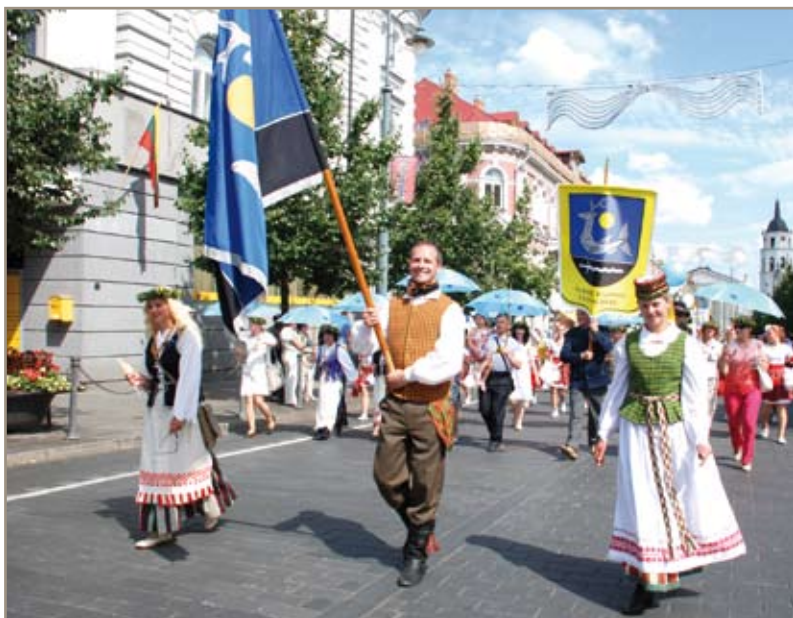
Didžiojamės, kad daugelis vaikų ir suaugusiųjų meno kolektyvų vyksta į Lietuvos valstybingumo atkūrimo šimtmečiui skirtą Dainų šventę

Puoselėjant kultūrą svarbus vaidmuo tenka meno kolektyvams. „Didžiojamės, kad daugelis vaikų ir suaugusiųjų meno kolektyvų vyksta į Lietuvos valstybingumo atkūrimo šimtmečiui skirtą Dainų šventę. Rajono tarybai pritarus, kolektyvams perkama nauja apranga, iš savivaldybės biudžeto remiamas kolektyvų pasirėngimas šiam reikšmingam įvykiui“, – kalba rajono meras ir priduria, kad kultūrai, religijoms ir poilsio funkcijoms skiriama per 14 proc. savivaldybės biudžeto.