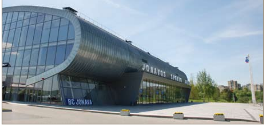
Arena vis labiau tampa mėgstama jonaviečių laisvalaikio vieta

Pasak jo, Jonavos rajone paskutinėje uždarytoje mokykloje mokėsi 11 mokinių. Ir visi vienoje jungtinėje klasėje – nuo pirmoko iki ketvirtoko. „Tačiau ir dėl tos mokyklos uždarymo buvo kilęs didelis triukšmas. Opozicija kaltino, kad pozicija nesirūpina kaimo žmogumi, kad uždarius mokyklą sunyks ir kaimas. Kaip paprastai, po kurio laiko triukšmas nurimo ir visi patenkinti. Kaime yra darželis, vaikai vežiojami į mokyklą, jų švietimo kokybė pagerėjo“, – pasakoja meras.