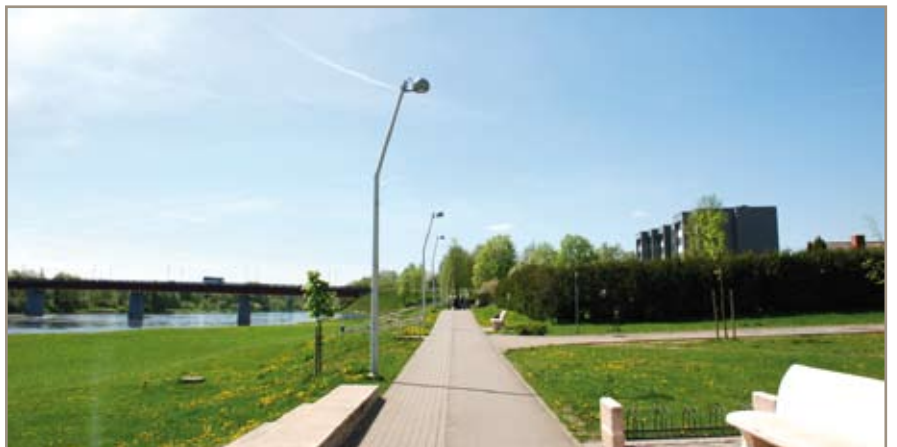
Važiuojant per Neries tiltą, akis užkliūna už paneriais vingiuojančių dviračių takų