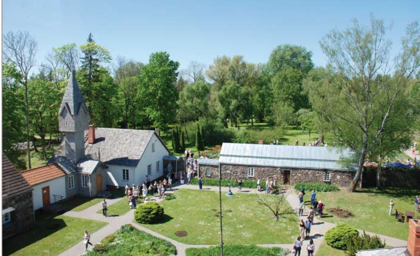
Burbiškio dvarą aplankė ir žydinčių tulpių sode fotografavosi, klausėsi koncertų per 20 tūkst. žmonių

ir Estijos vėliavų spalvų popierinės gėlės traukė žmonių dėmesį. Skambėjo Sąjūdžio laiko dainos, tvyrojo Baltijos kelio jaudulys. Šeduvos gimnazijos bendruomenė kvietė įsiskirti į šiandieninės Lietuvos sūkurį. Gimnazistų sukurtą užduočių ruožą įveikę dalyviai galėjo gauti atminimo medalį.