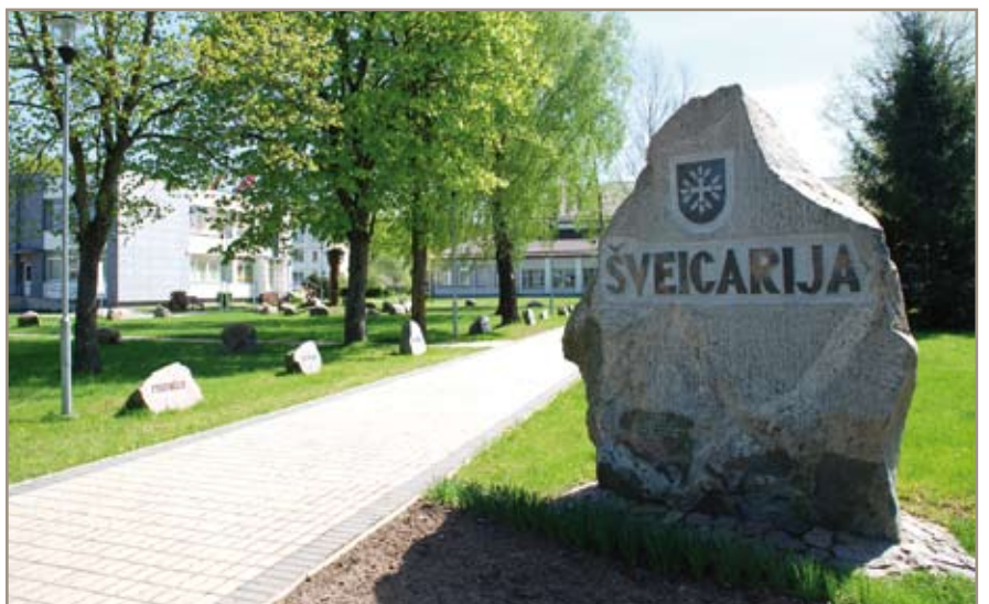
Toli važiuoti nereikia, Jonavos rajone yra Šveicarija