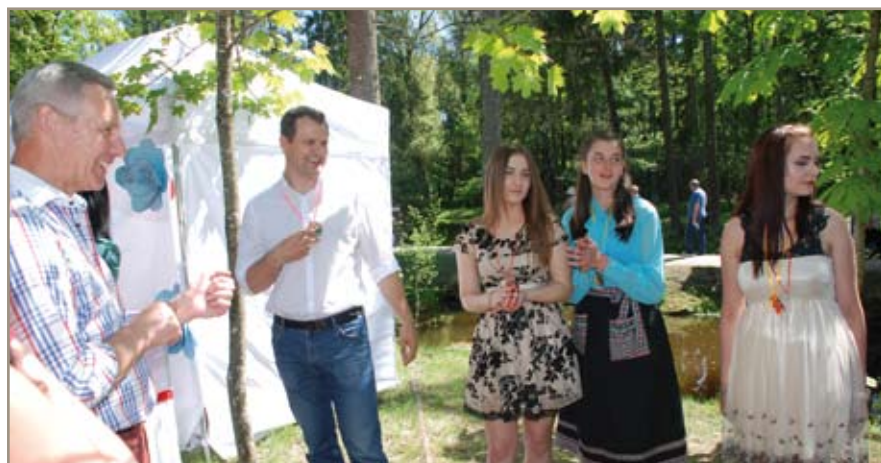
Vilniaus miesto mero pavaduotojas Gintautas Paluckas (antras iš kairės) į šventę atvyko pirmą kartą ir liko patenkintas. Šeduvos gimnazijos bendruomenė už teisingai atsakytą klausimą jam įteikė medalį