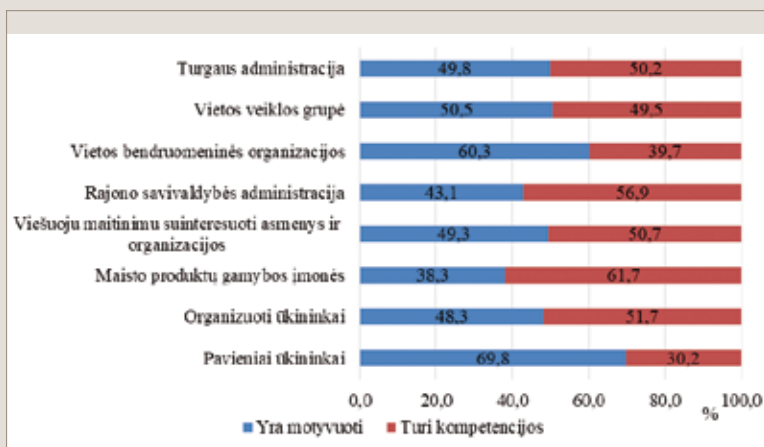
1 pav. Respondentų nuomonė apie pagrindinius vietos maisto sistemos suinteresuotuosius, kas galėtų inicijuoti vietos maisto sistemą, proc.

Atliekant tyrimą buvo daroma prielaida – kai suinteresuotieji turi stipriausią motyvaciją ir kompetenciją būti visaverčiais VMS dalyviais, galima pasiekti geriausių rezultatų. Tačiau tyrimo rezultatai parodė, kad iničiuoti VMS labiausiai motyvuoti turėtų būti pavieniai ūkininkai, vietos bendruomeninės organizacijos ir vietos veiklos grupės, tačiau kompetencijos turi daugiausia maisto produktų gamybos įmonės ir savivaldybės administracija. Organizuoti