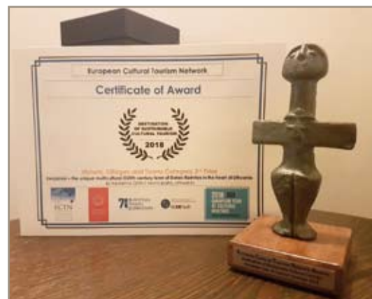
Kėdainiečių parsivežtas apdovanojimas

Pastaraisiais metais turistų skaičius ir su turizmu susijusi veikla Kėdainiuose sparčiai didėja. Vien tik per 2017 metus Kėdainių krašto muziejų aplankė beveik 26 tūkst. žmonių, surengta 130 įvairių renginių ir daugiau nei 900 edukacinių veiklų. Praėjusiais metais mieste buvo apsistoję daugiau kaip 9000 turistų, iš kurių beveik pusė užsieniečių.