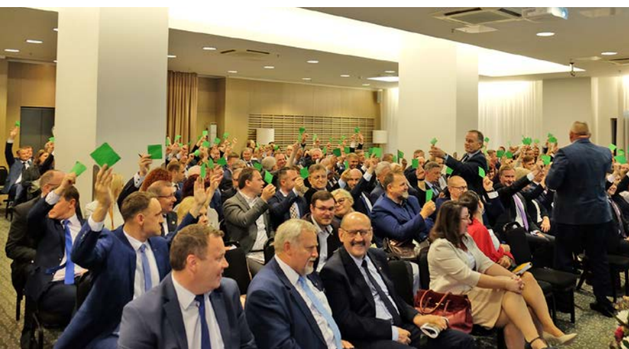
Balsuoja naujoji LSA taryba